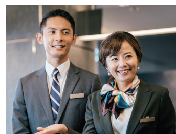
ホテル・観光案内